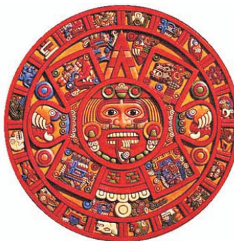
O Calendário Maia.

“Há um caso de previsão de fim de mundo, que me chama a atenção, o fato está registrado, e conta a história de um astrólogo chamado Johannes Stoeffler, alemão, que previu no ano de 1524, uma conjunção de 20 planetas, esse astrólogo associou essa conjunção planetária ao signo de peixes. Schoeffler tinha uma grande reputação. Fazia parte de uma grande universidade alemã, e tinha os sinais do zodíacos bordados a fios de ouro. Era conselheiro, e tinha a reputação entre os prelados alemães. Escreveu um livro cujo o título era “Efeméride” esse livro previa esse grande cataclismo sobre o signo de peixes, o que assinalava que o mundo seria novamente inundado por águas, algo muito parecido com o dilúvio bíblico. Isso se daria em 20 de fevereiro de 1524! Com a chegada da data especificada, toda a Europa se conturbou, muitos construíram arcas para salvar a família, os teólogos discutiram o assunto, o povo assustado queria salvar a própria vida e de seus familiares. Pouco