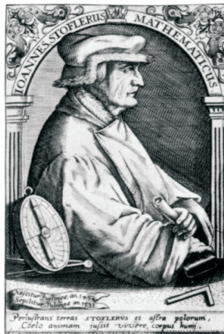
Johannes Stoeffler, alemão, que previu no ano de 1524, uma conjunção de 20 planetas, esse astrólogo associou essa conjunção planetária ao signo de peixes.

pecado? Haveria uma grande confusão, homicídios, suicídios, desespero e comportamento histérico e desesperado de multidões. Eu não faço idéia do que possa ocorrer na sociedade, se algo acontecer em 2012, que venha a fazer com que o povo acredite que algo terrível vai realmente acontecer nesse ano”.