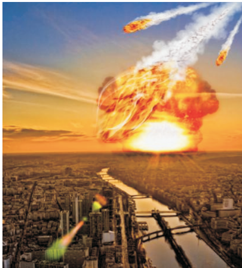
Imagem da internet.

“Os desastres naturais parecem cada vez piores. Desde 1900, cinco dos dez piores terremotos da história aconteceram nos últimos 8 anos. A informação foi repassada no Twitter pela rede AccuWeather”. 5