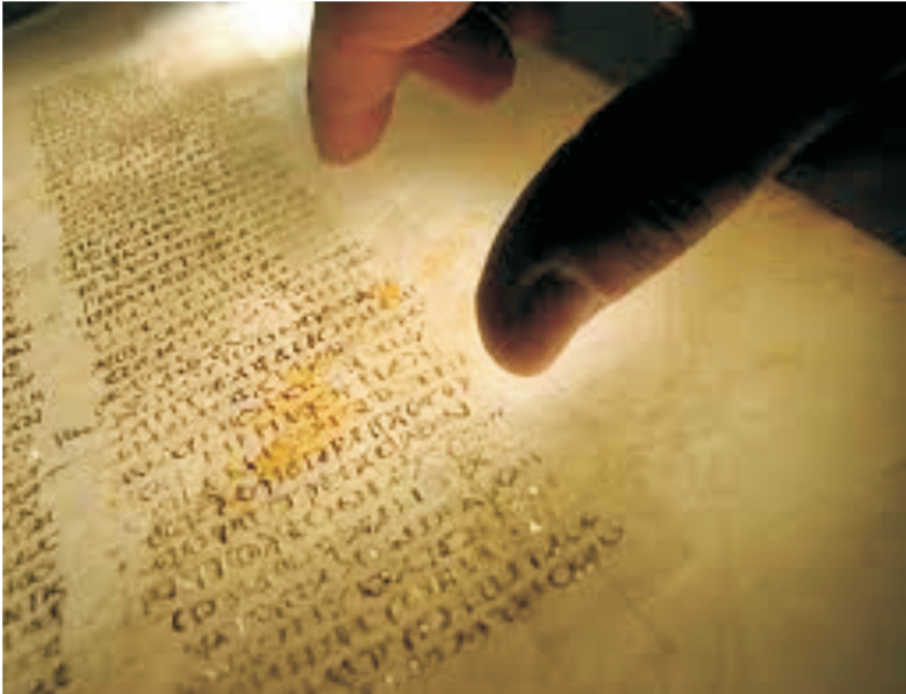
Imagem da internet.

iminência em conjunto com eventos escatológicos”. 1 (o grifo é meu)