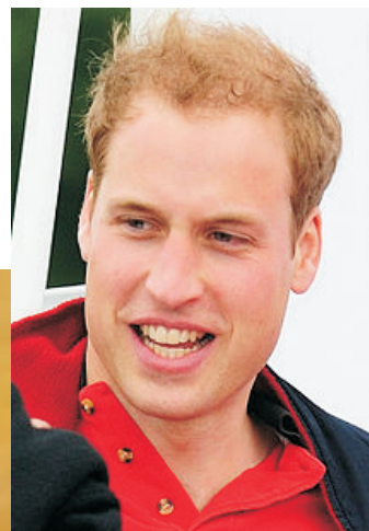
Príncipe William filho da princesa Diana.

O perigo das doutrinas humanas sobre o Anticristo é que desviam a atenção dos fiéis das verdadeiras ameaças em forma de tentações e doutrinas contra Cristo, porque as pessoas examinam os jornais procurando sinais da vinda de uma figura terrível. Ao invés de esperar a vinda de um grande inimigo de algum outro país, devemos nos defender contra os inimigos de Cristo que já estão no mundo desde a época da Bíblia". 3